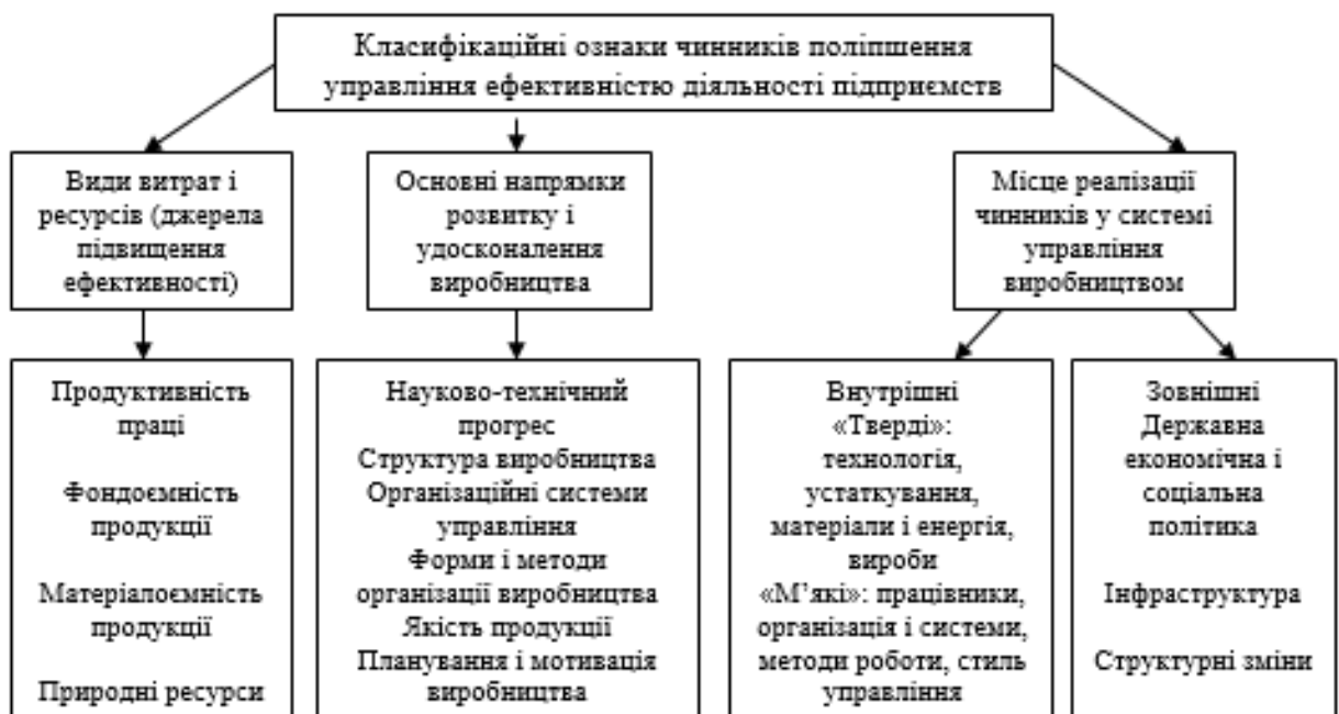
Рис. 1.2. Класифікаційні ознаки чинників поліпшення управління ефективністю діяльності суб'єктів господарювання (irbis-nbu.gov.ua)

Особливості класифікації факторів, що покращують управління ефективністю діяльності суб'єктів господарювання, проілюстровано на рис. 1.2.