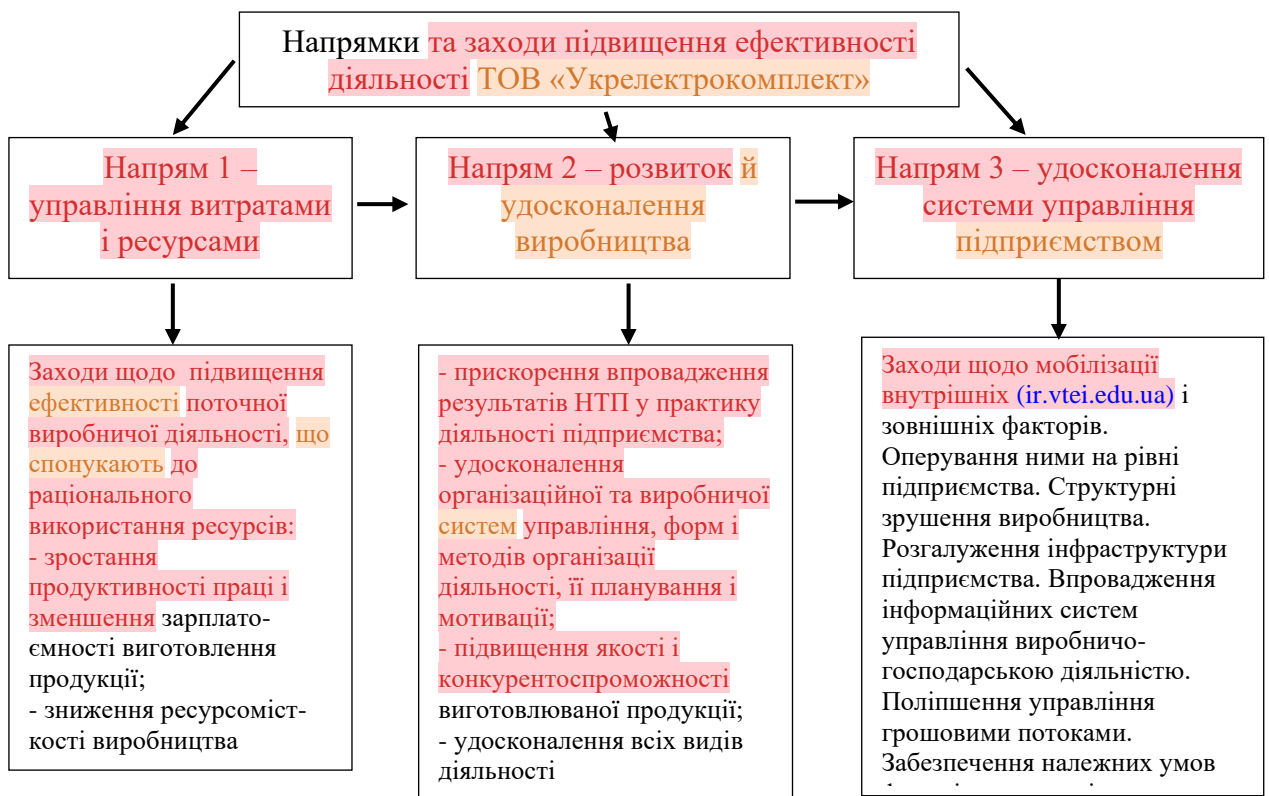
Рис.3.1. Напрями підвищення ефективності діяльності ТОВ «Укрелектрокомплект»

Враховуючи результати проведеного аналізу, було виділено наступні основні напрямки підвищення ефективності функціонування ТОВ «Укрелектрокомплект» (рис.3.1.):