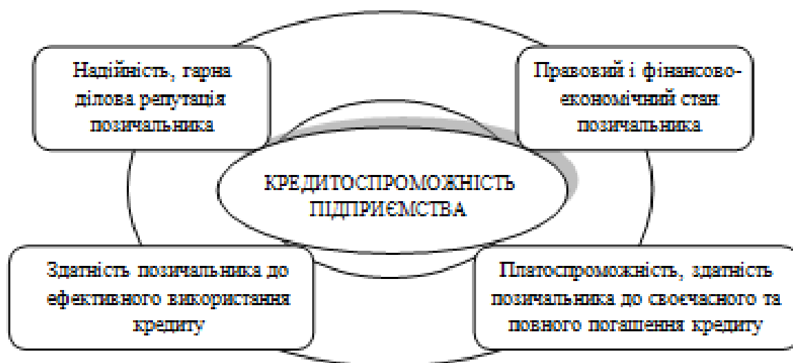
Рисунок 1.1 - Комплексний підхід до сутності категорії "кредитоспроможність підприємства" (розроблено на основі [34])

Відзначимо, що тлумачення кредитоспроможності підприємства має комплексний характер, що відображено на рис. 1.1.