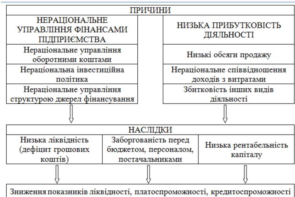
Рис. 3.1 – Основні причини зниження кредитоспроможності підприємства

Наступний блок причин пов'язаний з управлінням прибутковістю діяльністю підприємства. Зниження обсягів реалізації продукції, особливо нижче порогу рентабельності, призводить до зменшення валового прибутку, прибутку від операційної діяльності ( surl.li ) та навіть отримання збитків.