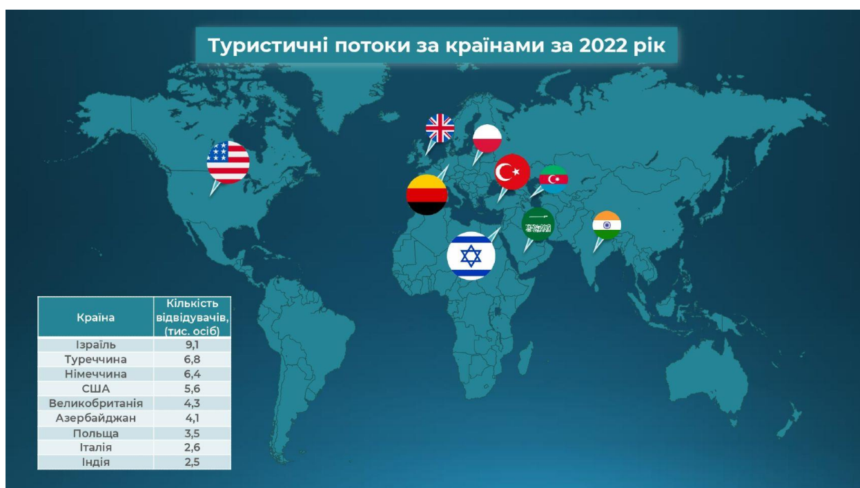
Рис. 1.7 – Динаміка зміни туристичних потоків за країнами станом на 2022 р.