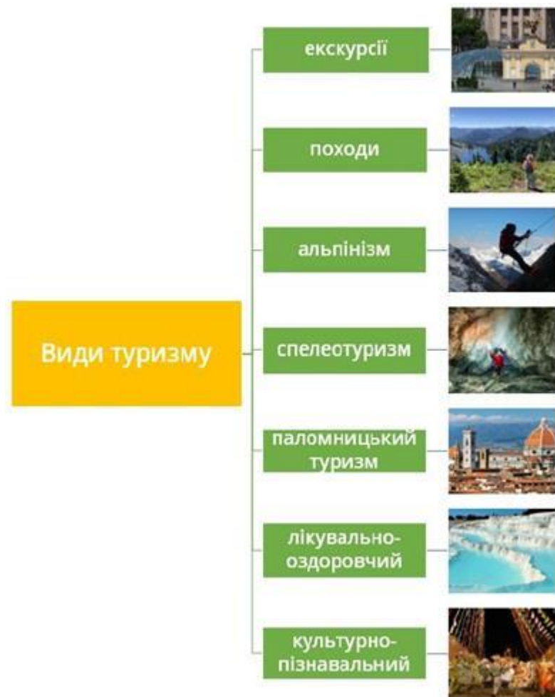
Рис. 1.2 – Види туризму залежно від мети подорожі [2]