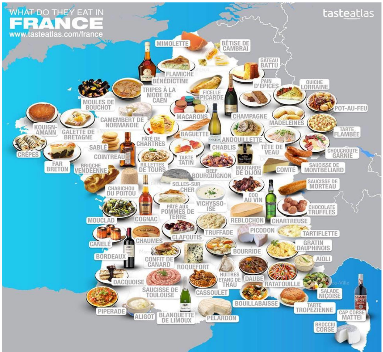
Рис. 2.3 – Гастрономічний образ Франції

Туристична спільнота Франції, беручи до уваги цей факт, прагне зберегти статус країни як світової гастрономічної столиці. До речі, в країні існує система маркування ручної роботи в галузі харчування, вимогами якої є мінімальне використання заморожених продуктів і максимальне використання свіжих інгредієнтів. Продукти місцевого виробництва також отримують особливі захищені етикетки з позначенням регіону [22].