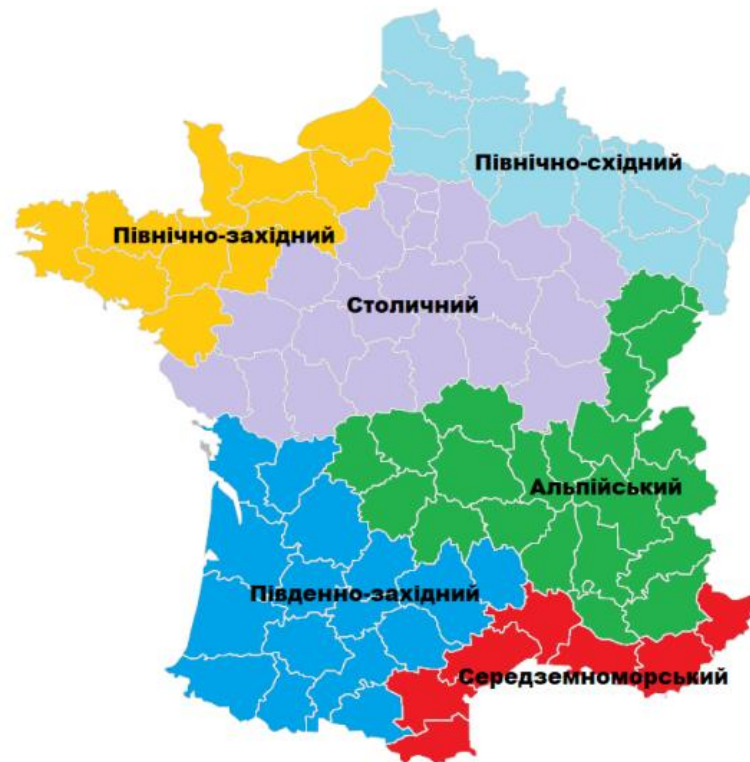
Рис. 2.1 – Туристичні райони Франції