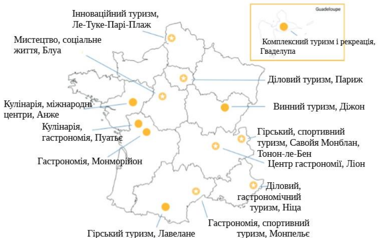
Рис. 2.2 – Основні центри розвитку туризму у Франції за регіонами

Основні центри розвитку туризму у Франції за регіонами наведені на рисунку 2.2 [1].