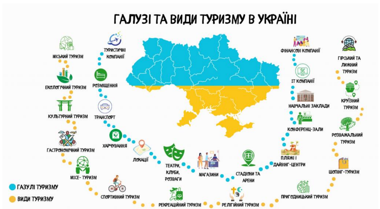
Рис. 1.3 – Галузі та види туризму в Україні

Важливим напрямом розвитку сучасної туристичної індустрії є пізнавальний туризм, який сьогодні стає надзвичайно популярним. Зростання популярності пізнавального туризму обумовлена актуальністю даного виду туризму, що закладена в його сутність [4]: він покликаний служити ідеям інтелектуальної і моральної солідарності людства, утвердженню ідеалів толерантності в суспільстві, тобто повазі, прийняттю і правильному розумінню різноманіття культур нашого світу. У сучасних умовах культурному туризму відводиться роль ефективного фактору і інструменту зближення народів, запобігання конфліктності і нетерпимості, виховання поваги та толерантності. ( dspace.nuft.edu.ua )