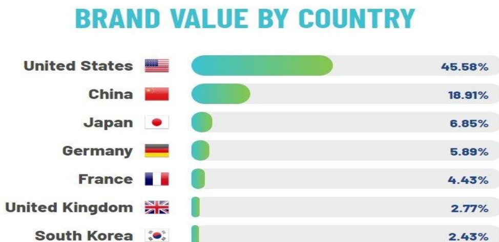
Рис. 1.8 – Туристична привабливість країн світу, виражена в показнику бренду країни, станом на 2020 р.

Туристична привабливість країн світу, виражена в показнику бренду країни, наведена графічно на рисунку 1.8 [18].