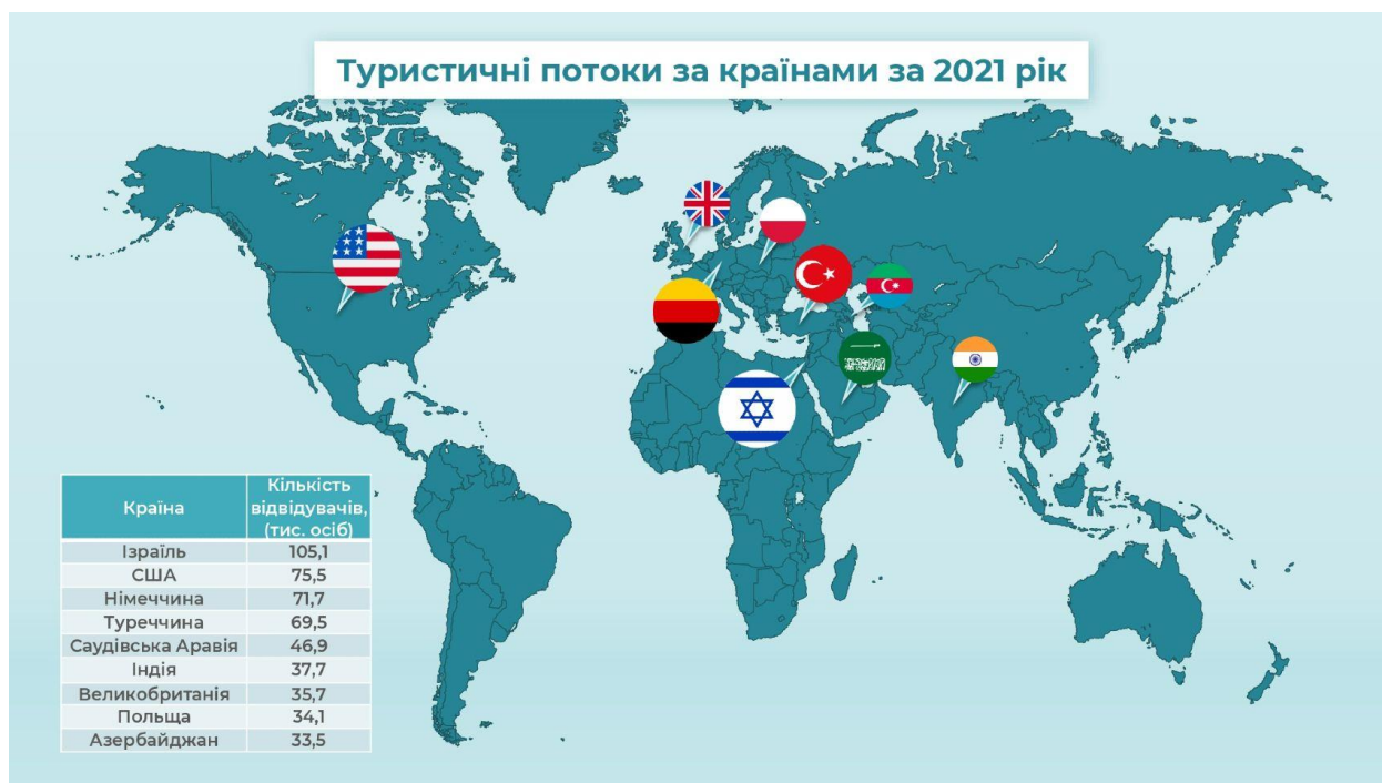
Рис. 1.6 – Динаміка зміни туристичних потоків за країнами станом на 2021 р.

Динаміка зміни туристичних потоків за країнами станом на 2021 р. та 2022 р. наведена на рисунках 1.6 та 1.7, відповідно [17].