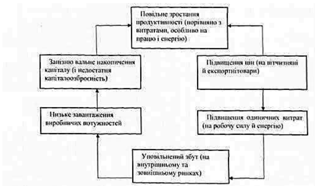
Рис. 1.3. Модель “пастки” низької продуктивності

Схематично залежність результатів виробництва і ситуації в країні від низької продуктивності представлена моделлю “пастки” низької продуктивності (рис 1.3.)