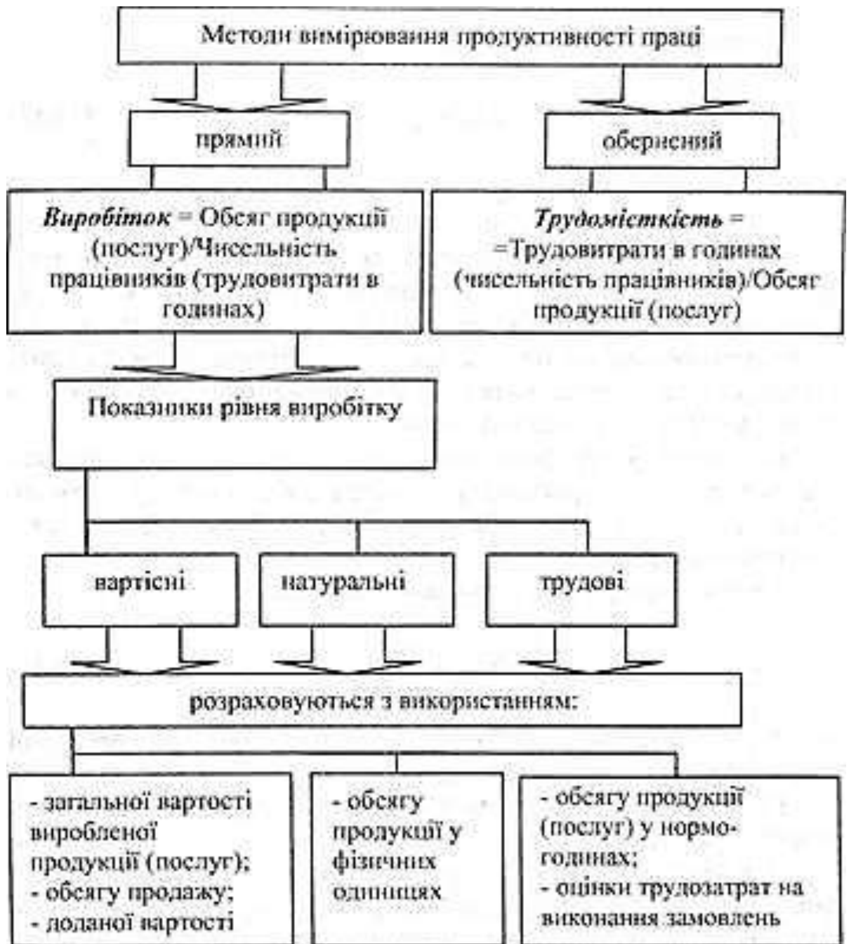
Рис. 1.1. Методи вимірювання продуктивності праці

Продуктивність праці вимірюється відношенням обсягу виробленої продукції до затрат праці (середньооблікової чисельності персоналу) . Залежно від прямого або зворотного відношення маємо два показники: виробіток і трудомісткість .