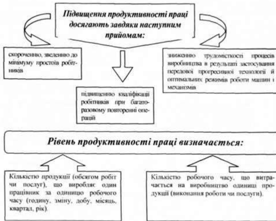
Рис. 1.2. Рівень продуктивності праці

Якщо показники виробітку мають більш узагальнюючий, універсальний характер, то показники трудомісткості можна розраховувати за окремими видами продукції (послуг) та використовувати для розрахунків потрібної кількості робітників, виявлення конкретних резервів підвищення продуктивності праці. Достовірність розрахунків зростає за визначення повної трудомісткості (технологічної, обслуговування та управління виробництвом). ( ua-referat.com )