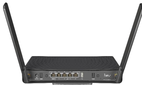
Рисунок 3 - MikroTik hAP ac 3 (RB4011 series)

Завдяки потужному процесору і оптимізованій архітектурі може ефективно обробляти великий обсяг даних, забезпечуючи стабільну роботу мережі.