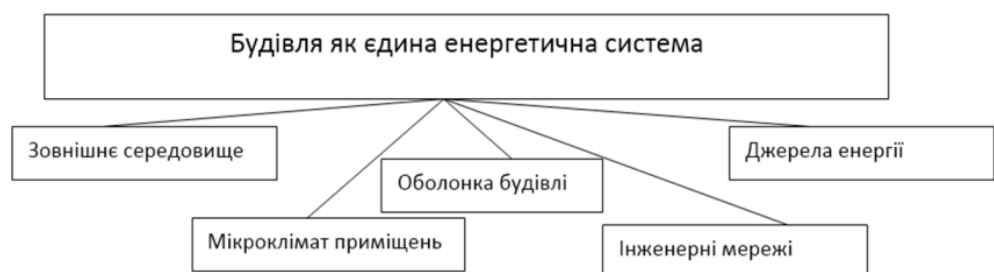
Рис. 1.1. Структура будинку, як енергетичної системи

Важливо зазначити, що досягнення конкретних показників енергоефективності існуючих промислових будівель можливе за допомогою різноманітних енергоефективних заходів (рис. 1.1). Приведення будівлі у відповідність до вимог кожної групи стандартів дасть різні результати для різних будівель.