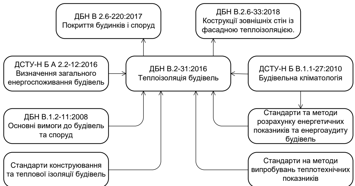
Рис. 1.2. Структура взаємозв'язків ДБН В.2.-31

Тобто досягнення питомих показників енергоефективності на основі питомих витрат енергії на опалення та охолодження можливе за допомогою заходів із впровадження окремих груп стандартів. Вплив цих заходів можна оцінити лише шляхом розрахунку показника енергоефективності будівлі згідно з ДСТУ-Н Б А 2.2-12:2015. -12:2015, щоразу змінюючи вхідні параметри. Тому потрібен алгоритм чи спеціалізоване програмне забезпечення, яке б не лише розраховувало показник енергоефективності будівлі згідно з ДСТУ-Н Б А 2.2-12:2015, а й пропонувало заходи щодо підвищення енергоефективності будівлі, на основі стандартів та досвіду ЄС з урахуванням економічної складової процесу впровадження енергоефективних заходів (рис. 1.2-1.3).