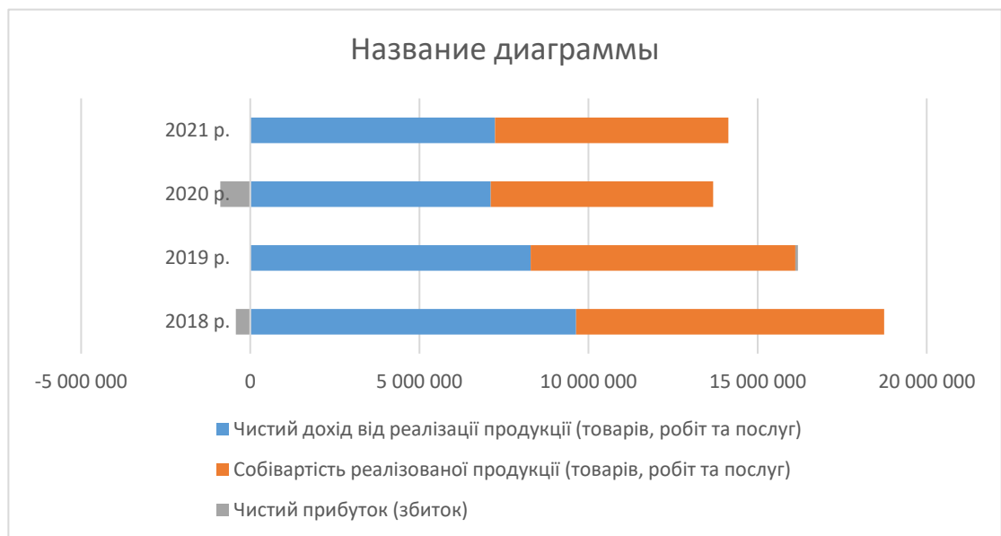
Рис. 2.1 Основні фінансові показники ПрАТ «Дніпроспецсталь» за 2018-2021 роки

Після проведення аналізу основних фінансових показників ПрАТ «Дніпроспецсталь» можемо зауважити, що на відміну від 2019 та 2021 років, 2018 та 2020 роки були збитковими. Основні фінансові показники підприємства можна представити у такому вигляді (рис. 2.1):