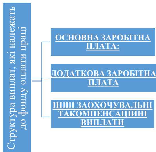
Рис. 1.2. Структура фонду оплати праці, запропонована Інструкцією зі статистики заробітної оплати

Основна заробітна плата- винагороди за виконання робіт згідно норм праці котрі встановлені на підприємстві за тарифними ставками та окладами, розцінками на відрядження робітників або посадовими окладами спеціалістів, фахівців, технічних службовців, керівників, також внутрішнє сумісництво; суми комісійних винагород залежно від обсягу доходів (виручки), отриманих від реалізації продукції (робіт, послуг), якщо вони є (core.ac.uk) основною заробітною платою.